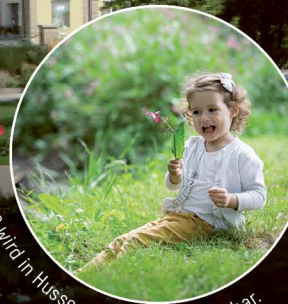
D Die Rems wird in Hussenhofen wieder erlebbar.