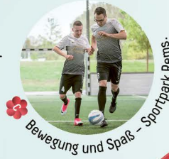
C Bewegung und Spaß – Sportpark Rems.

Steigen Sie ein in den Shuttlebus, der Sie in wenigen Minuten raus aus der Stadt bringt, hin zu den Höhepunkten, die im grünen Wiesen- und Weinberggürtel von Schorndorf auf Sie warten. Am Grafenberg A der neue Weinweg und die Raumskulptur, die im Rahmen des Architekturprojektes „16 Stationen“ entstanden ist. Oder an die Rems, die wieder in ihrem ursprünglichen Bett fließt B und weiter zum Sportpark Rems C und in den Bürgergarten D .