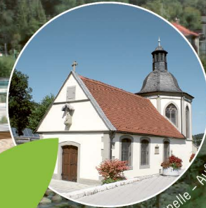
C Herrgottsruhekappele – Aufkunft der „Via Sacra“.