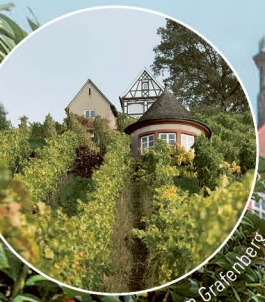
A Weinweg am Grafenberg.

Etwas außerhalb bietet der Himmelsgarten A Attraktionen wie den Aussichtsturm „Himmelstürmer“, Dinosauriergarten, Wasserspielplatz und eine Kugelbahn. Die weiße Station B bietet auf dem Lindenfirst grandiose Ausblicke. Vom Leonhardsfriedhof führt die „Via Sacra in Gamundia“ C über Kirchen und religiös geprägte Orte bis zur Felsenkapelle St. Salvator über der Stadt. Der Ausflug nach Hussenhofen D verspricht romantisches Dorfleben direkt an der Rems.