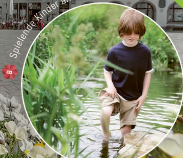
B Spielende Kinder an der Rems.