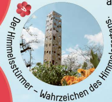
A Der Himmelstürmer – Wahrzeichen des Himmelsgartens.

Schwäbisch Gmünd und Schorndorf präsentieren gemeinsam die „Erlebnisgärten“ in der Stadt: Eine bunte Mischung aus Gartenflächen, Ausstellungen, neu inszenierten Aussichtspunkten und Veranstaltungen. In beiden Städten berechtigt die RemstalCard zum Besuch der kostenpflichtigen Gartenschau-Bereiche.