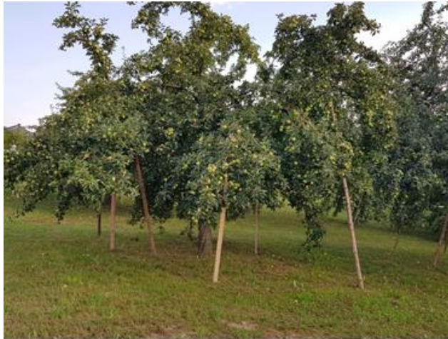
Abb 2: Vorbildlich abgestützte Fruchtäste an einem Hochstamm 2020

Laut Angaben des Verbandes der deutschen Fruchtsaft-Industrie e.V. (VdF) rechnen die deutschen Fruchtsafthersteller in diesem Jahr bundesweit mit 850.000 Tonnen Streuobststapfeln. Davon kommt gut die Hälfte aus Baden-Württemberg. Während im Osten die Erntemengen aufgrund fehlender Niederschläge geringer ausfallen, sorgten die regionalen Unterschiede im Süden für besonders gute Fruchterträge. Vergleicht man diese Zahl mit dem Rekordjahr 2018, in welchem 1,2 Millionen Tonnen Streuobststapfel geerntet wurden,